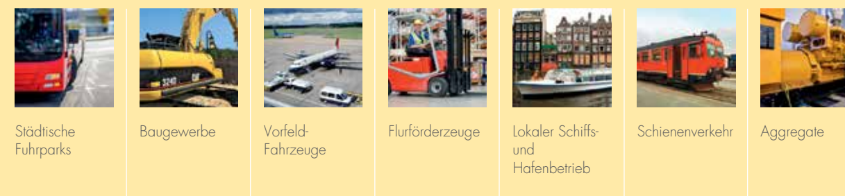
Städtische Fuhrparks Baugewerbe Vorfeld-Fahrzeuge Flurförderzeuge Lokaler Schiffs- und Hafenbetrieb Schienenverkehr Aggregate