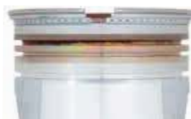
Mobil Pegasus™ 1105