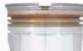
Mobil Pegasus™ 1107

Beide Mobil Pegasus™ 1100-Öle stellen wir aus einem optimierten Grundöl und ausgewogenen Additiven her.